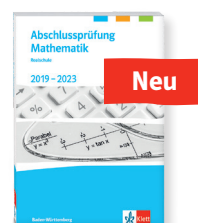
Abschlussprüfung Mathematik 2019 – 2023 ISBN 978-3-12-740348-0