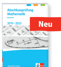
Abschlussprüfung Mathematik 2019 – 2023 ISBN 978-3-12-740348-0