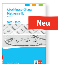
Abschlussprüfung Mathematik 2019 – 2023 ISBN 978-3-12-740348-0