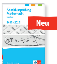
Abschlussprüfung Mathematik 2019 – 2023 ISBN 978-3-12-740348-0