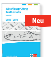
Abschlussprüfung Mathematik 2019 – 2023 ISBN 978-3-12-740348-0