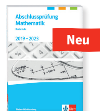
Abschlussprüfung Mathematik 2019 – 2023 ISBN 978-3-12-740348-0