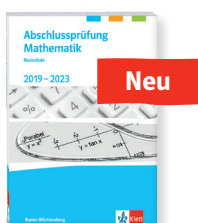
Abschlussprüfung Mathematik 2019 – 2023 ISBN 978-3-12-740348-0