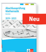
Abschlussprüfung Mathematik 2019 – 2023 ISBN 978-3-12-740348-0