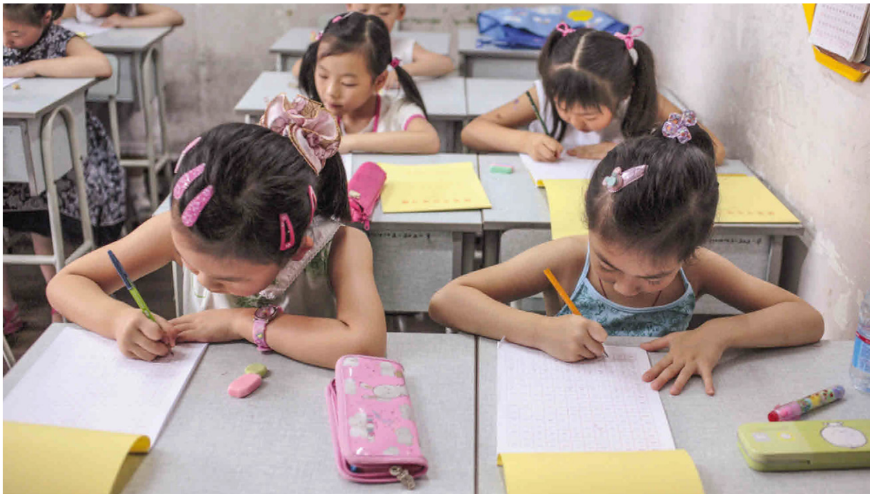
Schulkinder in Shanghai (China)

das Wort für „Schildkröte“ gerade vergessen hatte, nicht ablesen, was für ein Wort er sagen musste. 3 Im Lauf der Jahrhunderte entwickelte sich die Schrift weiter. Die Schriftzeichen vereinfachten sich. Statt zum Beispiel einen Menschen ganz zu zeichnen, entschied man sich nur noch für zwei Striche. Das Zeichen 人 für „Mensch“ war somit als Mensch überhaupt nicht mehr zu erkennen. So erging es auch dem Zeichen 龟 für „Schildkröte“. Es hat kaum mehr Ähnlichkeit mit einer echten Schildkröte. Zudem wurden einzelne Zeichen zusammengesetzt, und die neuen Schriftzeichen bekamen eine eigene Bedeutung. So wurde zum Beispiel aus dem Zeichen für „Schwein“ unter einem „Dach“ ein neues Schriftzeichen 家 mit der Bedeutung „Familie“. 4 [...] Früher haben die Chinesen von oben nach unten und von rechts nach links gelesen und geschrieben. Heute lesen und schreiben sie wie wir häufig