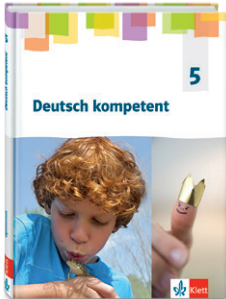
Deutsch kompetent 5 Schülerbuch ISBN 978-3-12-316201-5