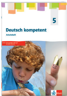
Deutsch kompetent 5 Arbeitsheft ISBN 978-3-12-316211-4