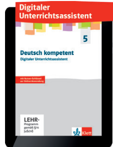
Deutsch kompetent 5 Digitaler Unterrichtsassistent (DUA) ISBN 978-3-12-316231-2