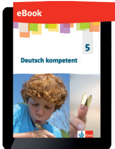
Deutsch kompetent 5 eBook Bestellung und weitere Informationen unter www.klett.de/deutsch-kompetent