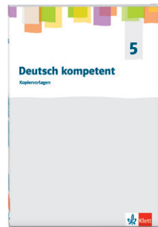
Deutsch kompetent 5 Kopiervorlagen ISBN 978-3-12-316281-7