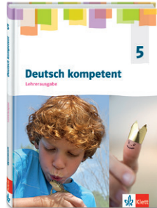
Deutsch kompetent 5 Lehrerausgabe ISBN 978-3-12-316221-3