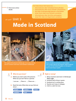
Beispiel aus Orange Line Grundkurs Band 3, ISBN: : 978-3-12-548173-2, S. 52

Teilziele sind unter anderem die Sicherstellung eines allgemeinen Zugangs zu bezahlbaren, verlässlichen und modernen Energiedienstleistungen, die Erhöhung des Anteils der erneuerbaren Energien am Energiemix, die Steigerung der Energieeffizienz sowie die Förderung von Investitionen in die Energieinfrastruktur und saubere Energietechnologien