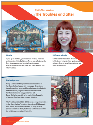
Beispiel aus Orange Line Grundkurs Band 3, ISBN: 978-3-12-548176-3, S. 134

Teilziele sind unter anderem die Verringerung aller Formen der Gewalt und der gewaltbedingten Sterblichkeit, die Beendigung des Missbrauchs und der Ausbeutung von Kindern, die Bekämpfung aller Formen der organisierten Kriminalität, die Reduktion der Korruption und Bestechung, der Aufbau leistungsfähiger, rechenschaftspflichtiger und transparenter Institutionen sowie die Förderung inklusiver, partizipativer und repräsentativer Entscheidungsfindung.