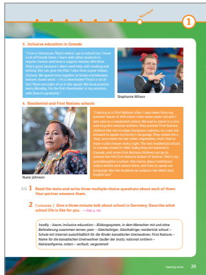
Beispiel aus Orange Line Band 6, ISBN: 978-3-12-548076-6, S. 29

Teilziele sind unter anderem die Sicherstellung, dass alle Kinder eine hochwertige Grund- und Sekundarschulbildung abschließen, die Sicherstellung, dass alle Kinder einen Zugang zu hochwertiger frühkindlicher Betreuung und Bildung sowie alle Menschen einen Zugang zu hochwertiger fachlicher, beruflicher und tertiärer Bildung erhalten, die Förderung der Bildung für nachhaltige Entwicklung sowie den Bau und Ausbau von Bildungseinrichtungen, die kinder-, behinderten- und geschlechtergerecht sind.