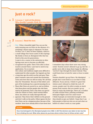
Beispiel aus Orange Line Band 5, ISBN: 978-3-12-548075-9, S. 12

Teilziele sind unter anderem die Gewährleistung der Erhaltung, Wiederherstellung und nachhaltigen Nutzung der Land- und Binnensüßwasser-Ökosysteme, die Förderung der nachhaltigen Bewirtschaftung aller Waldarten und die Erhöhung der Aufforstung bzw. Wiederaufforstung, die Neutralisierung der Landverödung und die Verringerung der Verschlechterung der natürlichen Lebensräume sowie die Erhaltung und Förderung der biologischen Vielfalt.