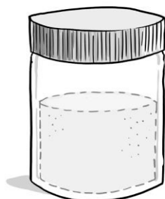
M1 Das beklebte Glas von außen (links) und die Füllmenge in der Röntgenaufnahme (rechts).