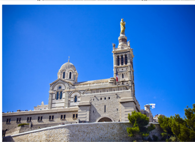
Notre-Dame de la Garde