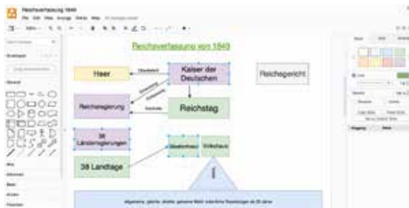
Beispiel: ein Schaubild digital erstellen