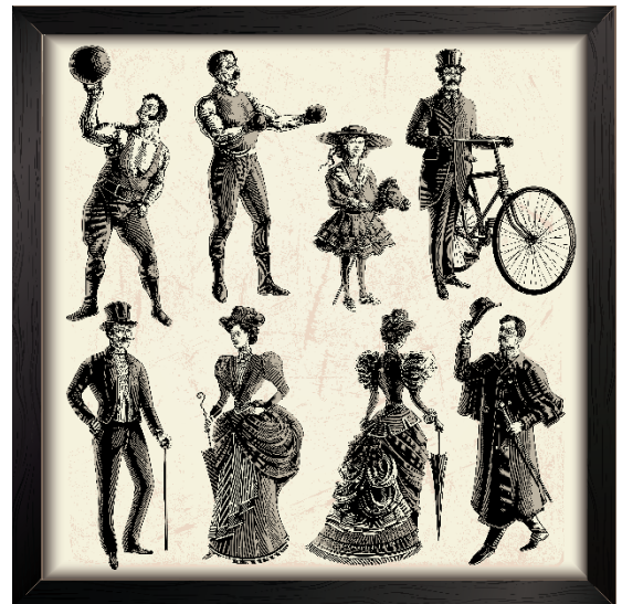
Figures from Victorian England