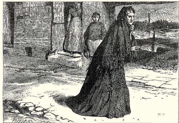
A scene from Dickens' Little Dorrit