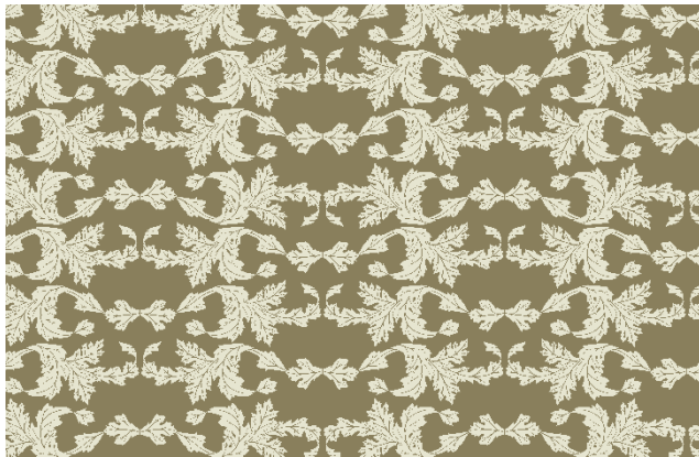
Vintage leaf pattern

Your college is twinned with a college in England. Both schools offer classes in art and design. As part of an online project, you are working with your partner college on a web page about the Victorian age in England. Both classes have read Victorian literature and now want to do some research into the English society of that time. Your task is to decide on a series of visual elements or illustrations that best represent this period in the history of England.