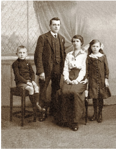
A family portrait

Your college is twinned with a college in England. Both schools offer classes in art and design. As part of an online project, you are working with your partner college on a web page about the Victorian age in England. Both classes have read Victorian literature and now want to do some research into the English society of that time. Your task is to decide on a series of visual elements or illustrations that best represent this period in the history of England.