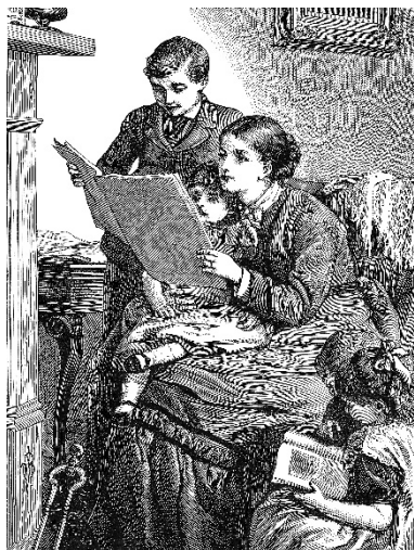
Victorian family scene

Your college is twinned with a college in England. Both schools offer classes in art and design. As part of an online project, you are working with your partner college on a web page about the Victorian age in England. Both classes have read Victorian literature and now want to do some research into the English society of that time. Your task is to decide on a series of visual elements or illustrations that best represent this period in the history of England.