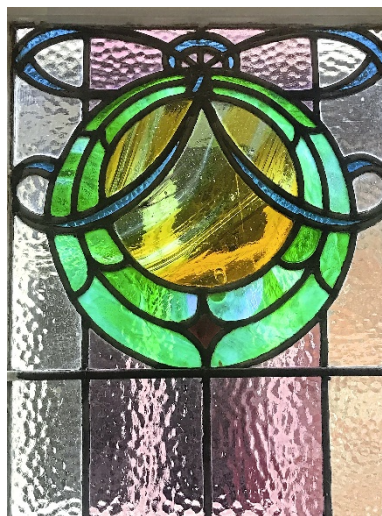
Stained glass window from the early 1900s