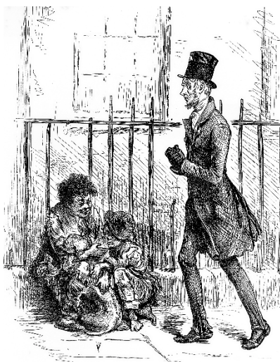
A scene from Dickens' Oliver Twist