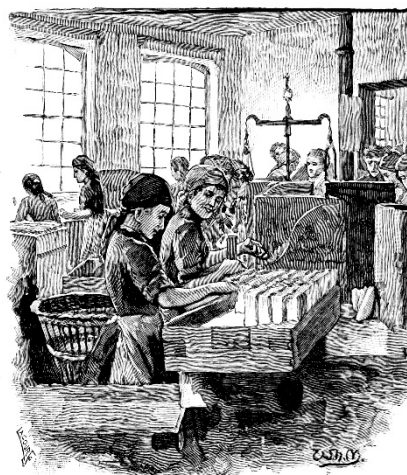
Young women and children working in a factory, 1892