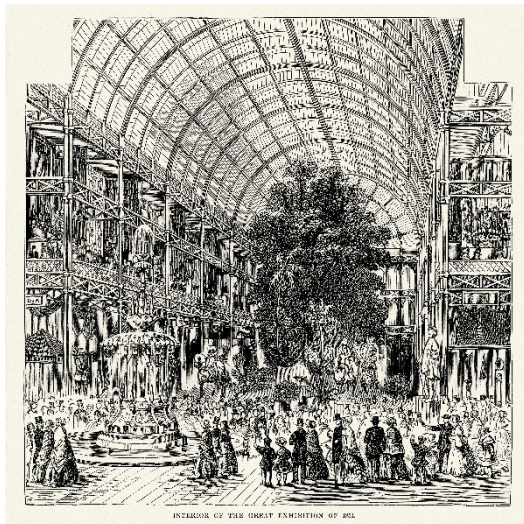
World Exhibition, Hyde Park, London, 1851