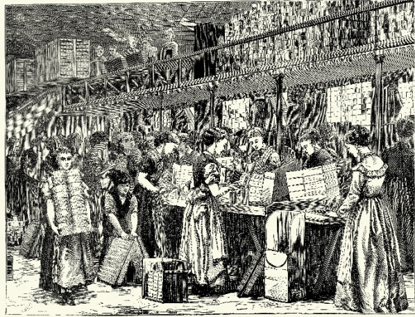
Young women and children working in a factory, 1871