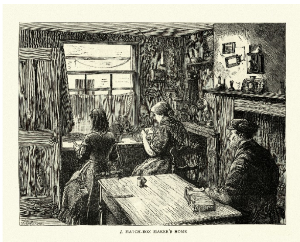
A matchbox maker's home, London, 1886