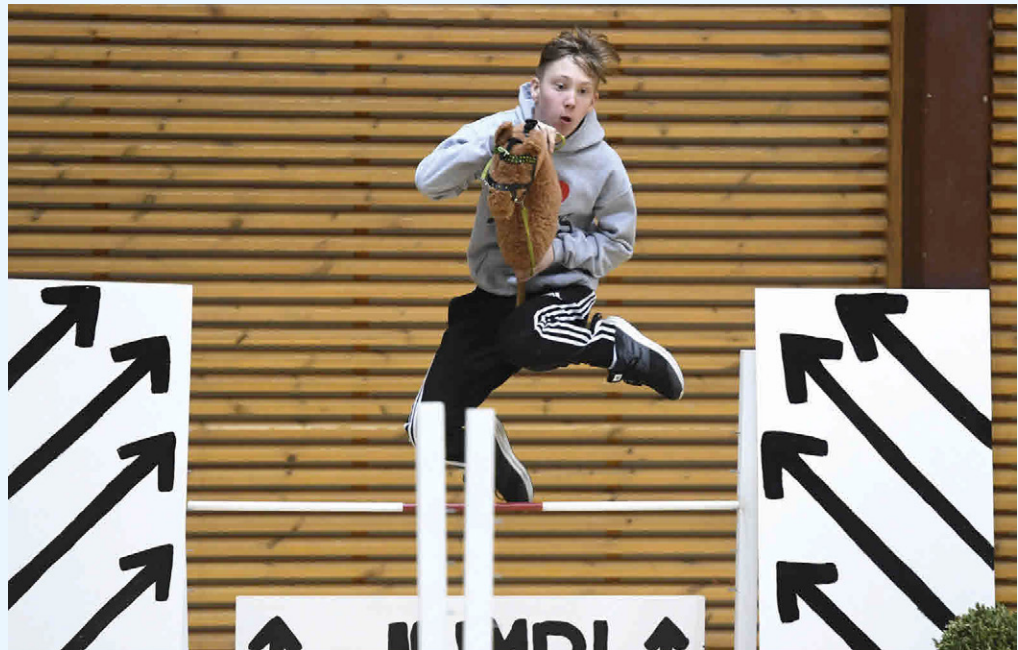
Sportart „Hobby Horsing“