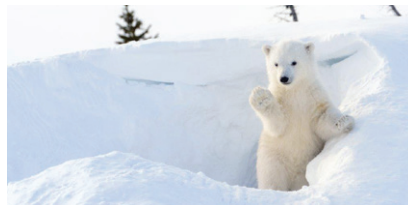
4. l'ours polaire

III – Des questions ? Réponds aux questions suivantes.