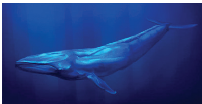
3. La baleine bleue