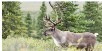
2. le caribou