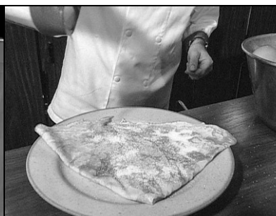
Pages & Images, Montpellier