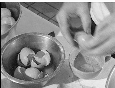
Pages & Images, Montpellier