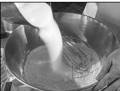
Pages & Images, Montpellier