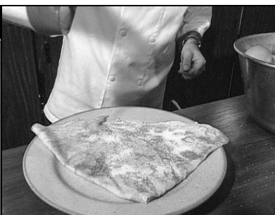
Pages & Images, Montpellier

Je sers la crêpe avec du sucre en poudre.