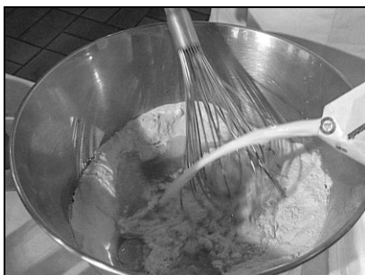
Pages & Images, Montpellier

Je mélange les œufs, la farine et le sucre et j'ajoute du lait.