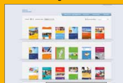
Produkte aller Bildungs- medienverlage