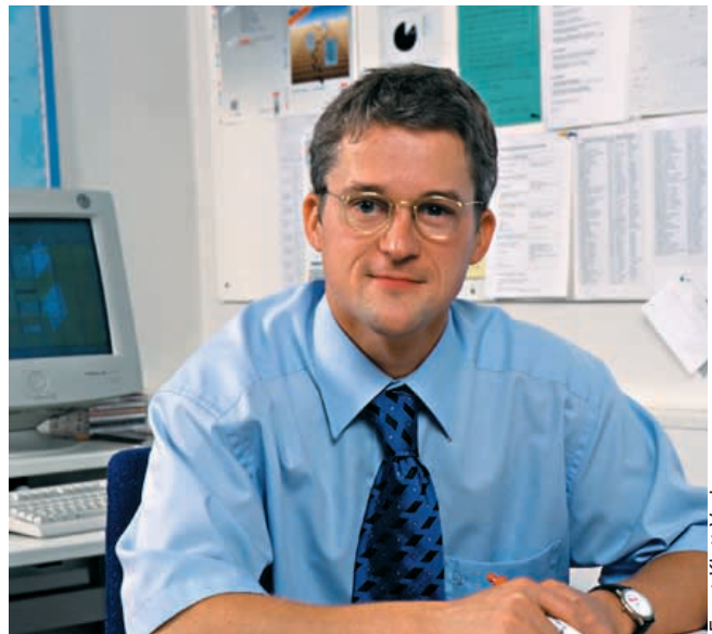
Ernst Klett Verlag

Anspruchsvoller geht es national und international an den Universitäten, Studienkollegs und Goethe-Instituten zu. Mit dem DaF-Lehrwerk „Stufen International“ ist Klett bereits im In- und Ausland etabliert und vermittelt das Deutsche eher akademisch ausgerichtet als Kultursprache. „Stufen International“ bietet ein breites Spektrum von Inhalten, ausgehend von Szenarien des All-