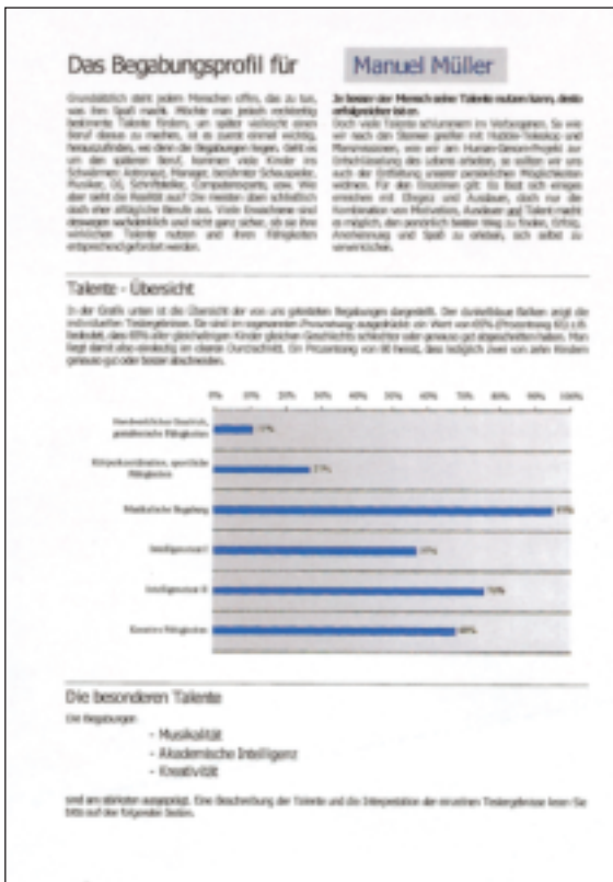
Auszug aus einem Begabungsprofil

Der BegabungsCheck wird in drei unterschiedlichen Paketen angeboten: