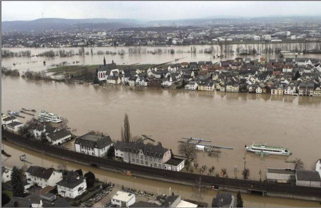
Mauritius Images GmbH (Thomas Frey)